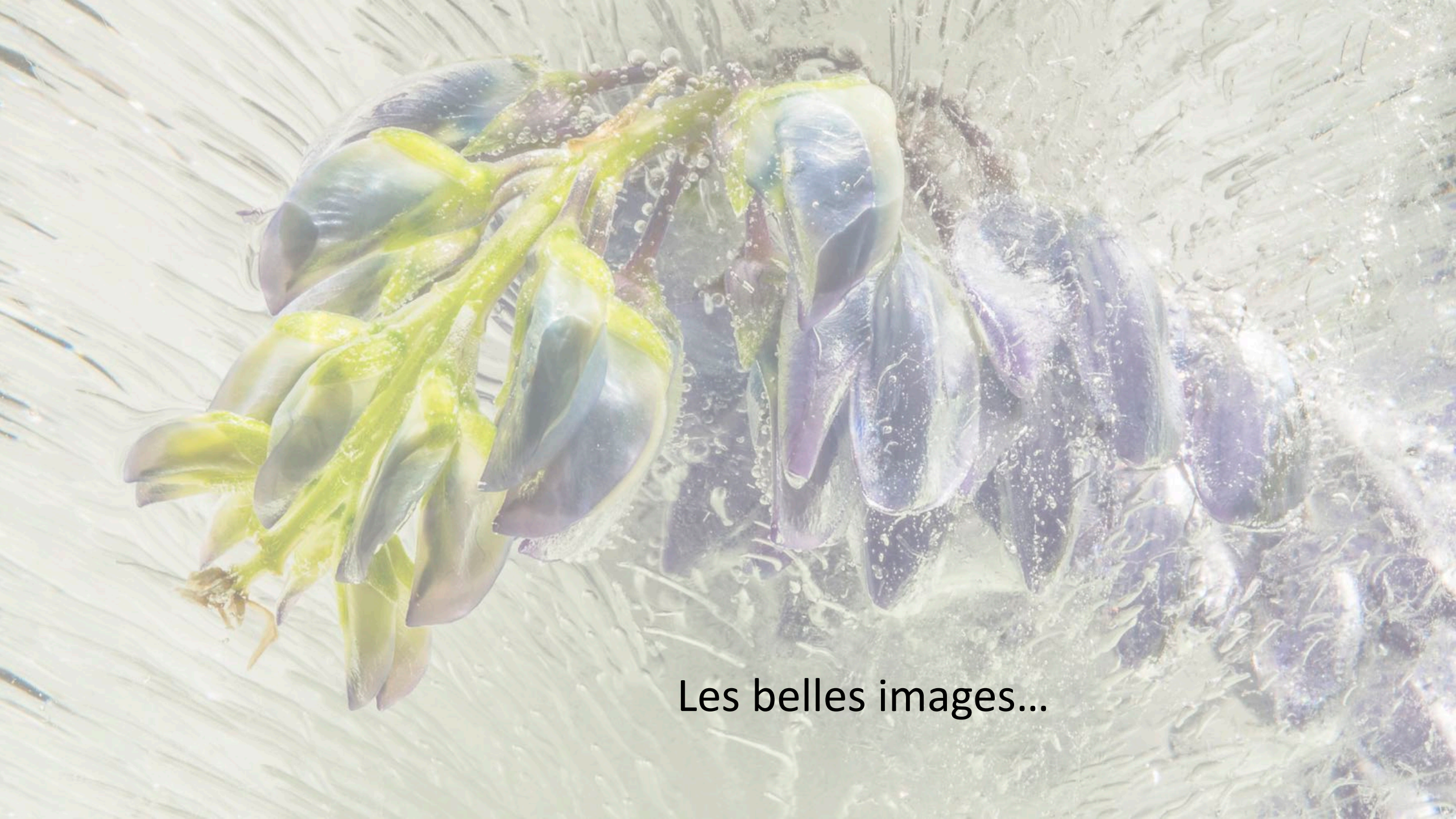
Les belles images...