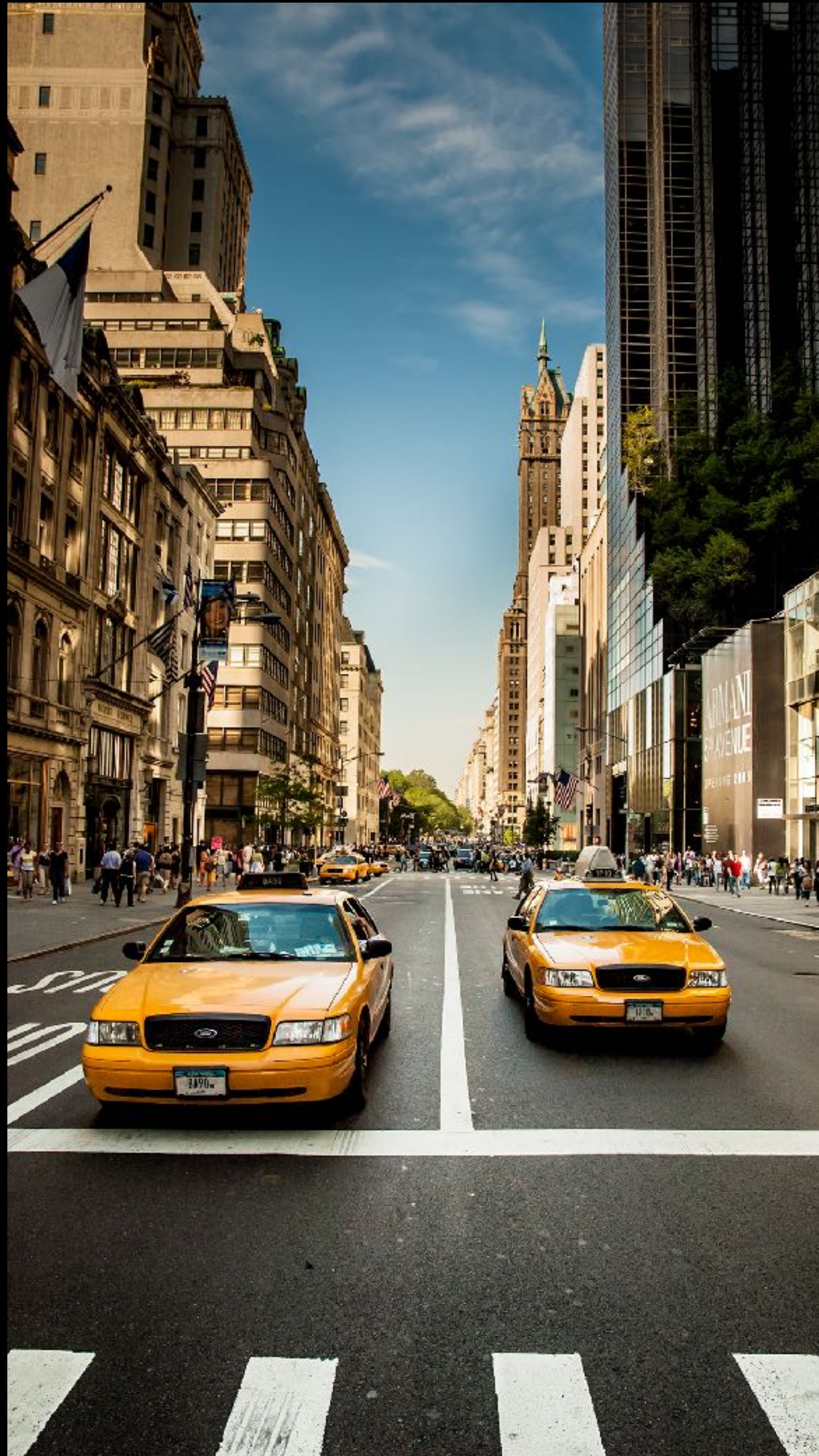
« sans titre » par Martin Labbé - Nikon D70, 18 (27) mm f/8, 1/250 s, ISO 200