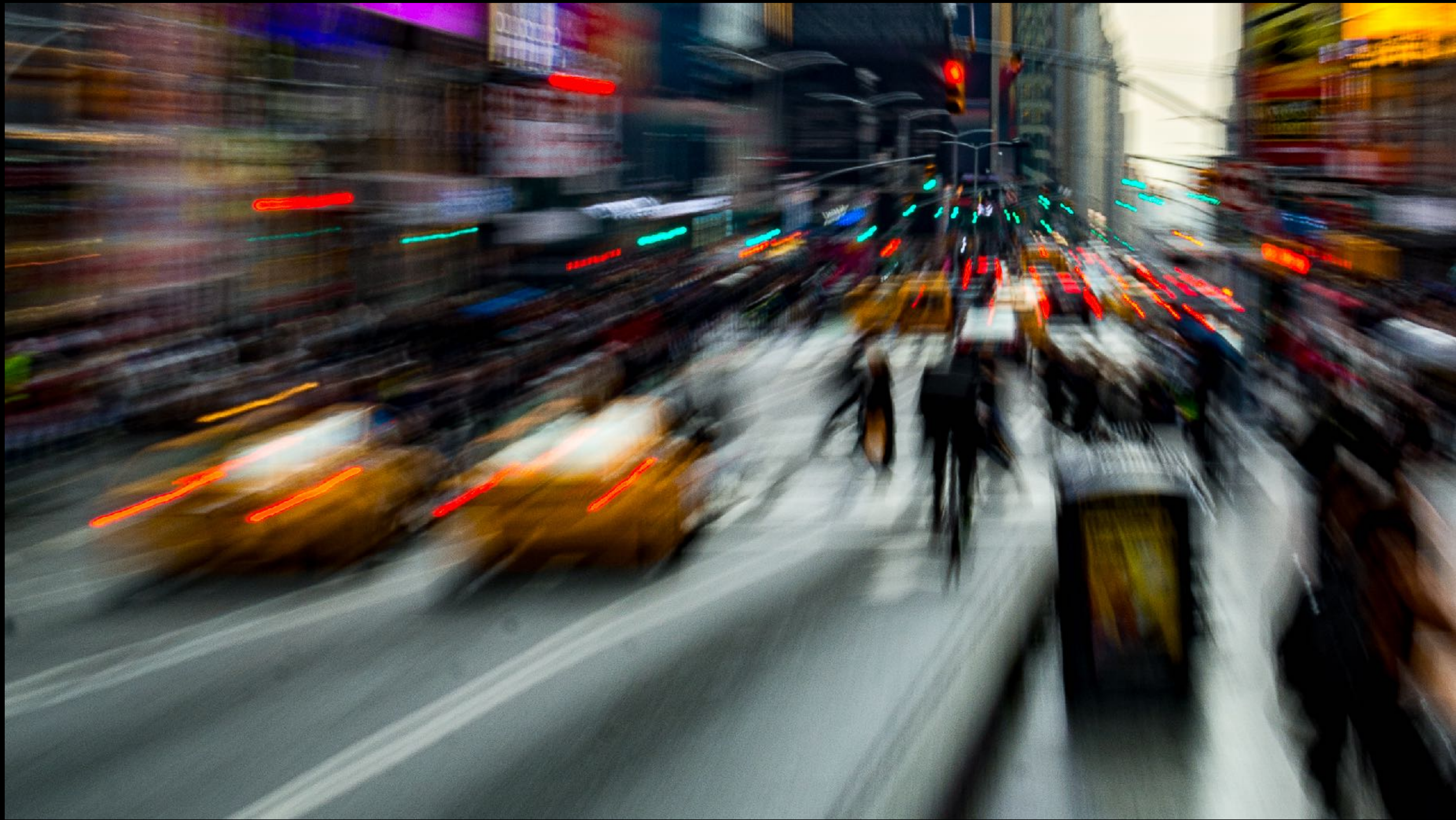
« Course folle taxi New-York » par Claude Labrecque - Nikon D7100, 38 (57) mm, f/25, 1/4 s, ISO 100